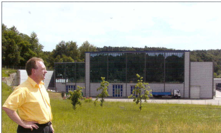
Die Gemeinde Bodenwöhr hat Potential. Sie muss sich in Zukunft aber auch vielen Herausforderungen stellen. Gefragt sind kreative Ideen, Tatkraft, Überblick, Weitsicht und die Fähigkeit, alle ins Boot holen zu können.

Ich will auf jeden Fall das Verantwortungsbewusstsein der Jugend stärken. Und das geht nur in der Gemeinschaft mit Ihnen, den Eltern, den Vereinen, die in